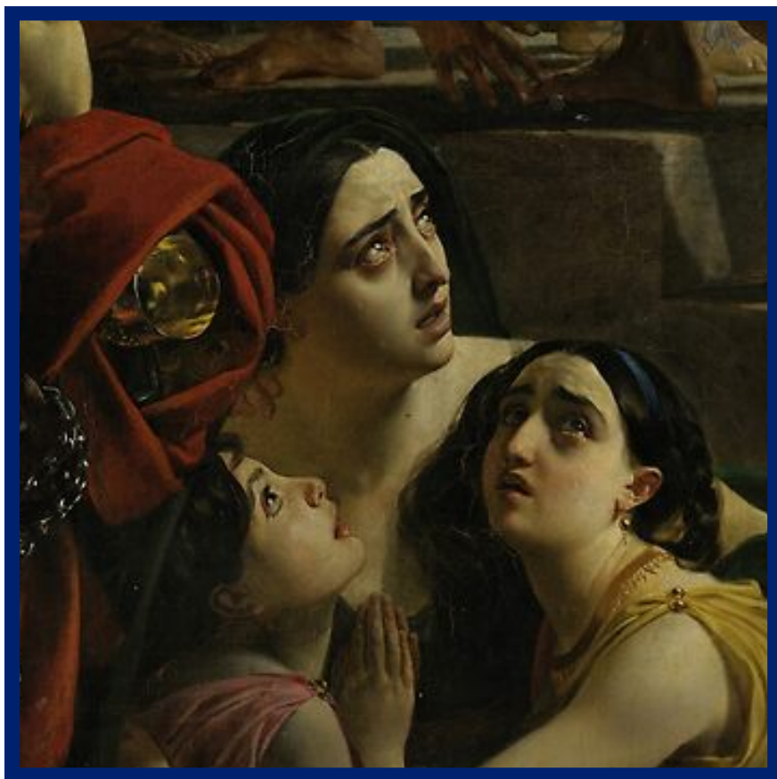
El último día de Pompeya Por Karl Briulov

En la semana anterior, en La Salle, se festejó el día de las madres, por lo que los alumnos tuvieron la oportunidad de ausentarse el viernes para festejar esta fecha con su familia. Del mismo modo, esta semana será la última del Ciclo escolar, por lo que esta edición de La Gaceta es la última. Desde el equipo editorial les deseamos muy felices vacaciones y mucha suerte en sus exámenes.