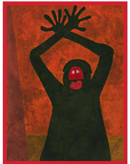
Rufino Tamayo -protesta

La lucha por un país donde la violencia no tenga cabida y los derechos humanos sean respetados es un compromiso que debemos mantener vivo.