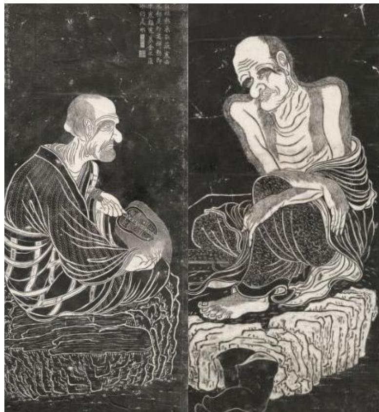
Serie de 16 obras hechas por el monje Guanxiu

En este nuevo año 2025, el animal que regirá es la Serpiente, la cual se caracteriza por traer buena suerte y generar riquezas.