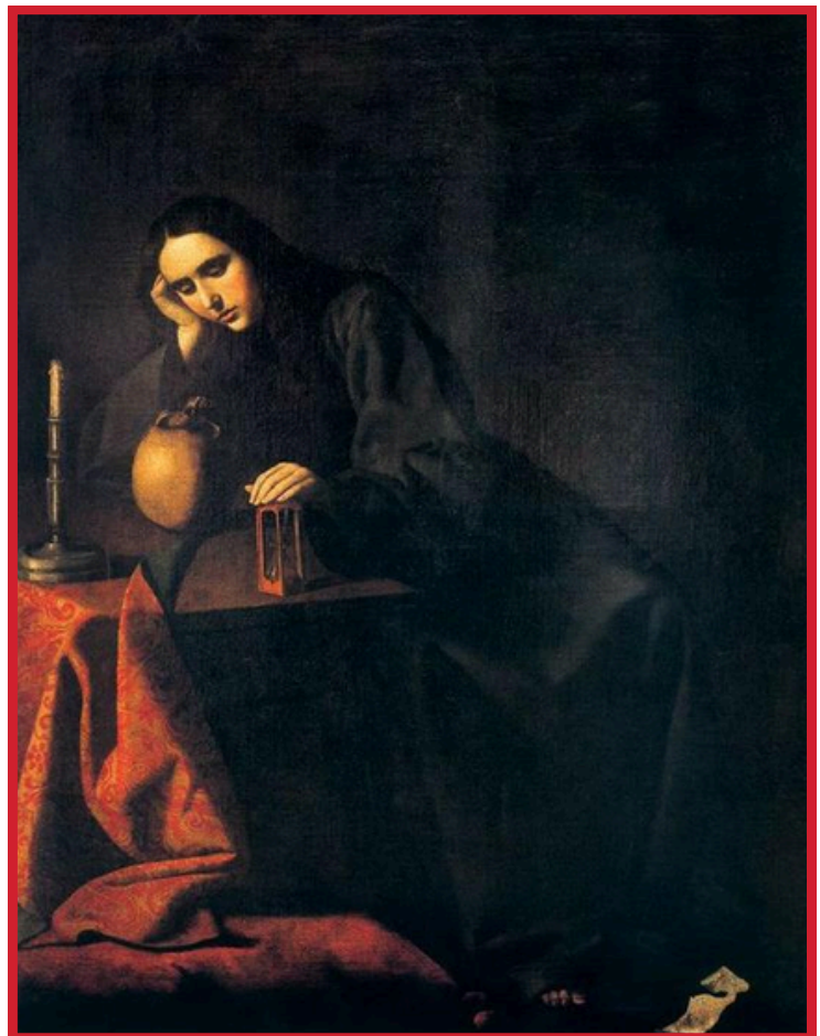
Magdalena Penitente - Francisco Zurbarán

Con una imagen de lo más bello, caigo rendido ante tus órdenes, pero que presiento con fuerte sello.